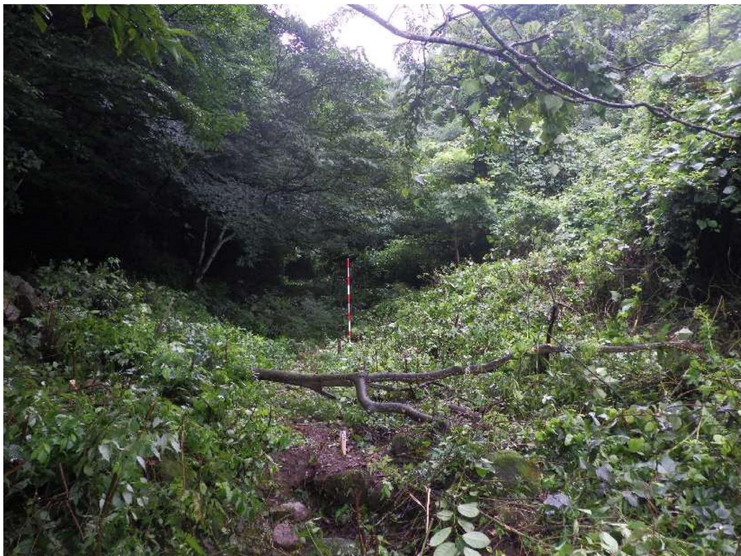
溪流の状況(測点No.9 付近)